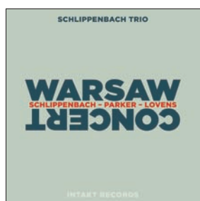
SCHLIPPENBACH TRIO WARSAW CONCERT Alexander von Schlippenbach, Evan Parker, Paul Lovens Intakt CD 275